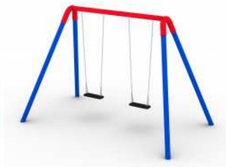
Huśtawka z profili okrągłych.