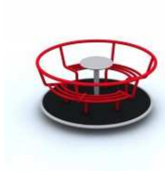
Karuzela z czterem siedziskami.