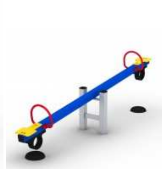
Ważka ze stali ocynkowanej malowanej proszkowo, siedziska z HDPE, odbojnice gumowe